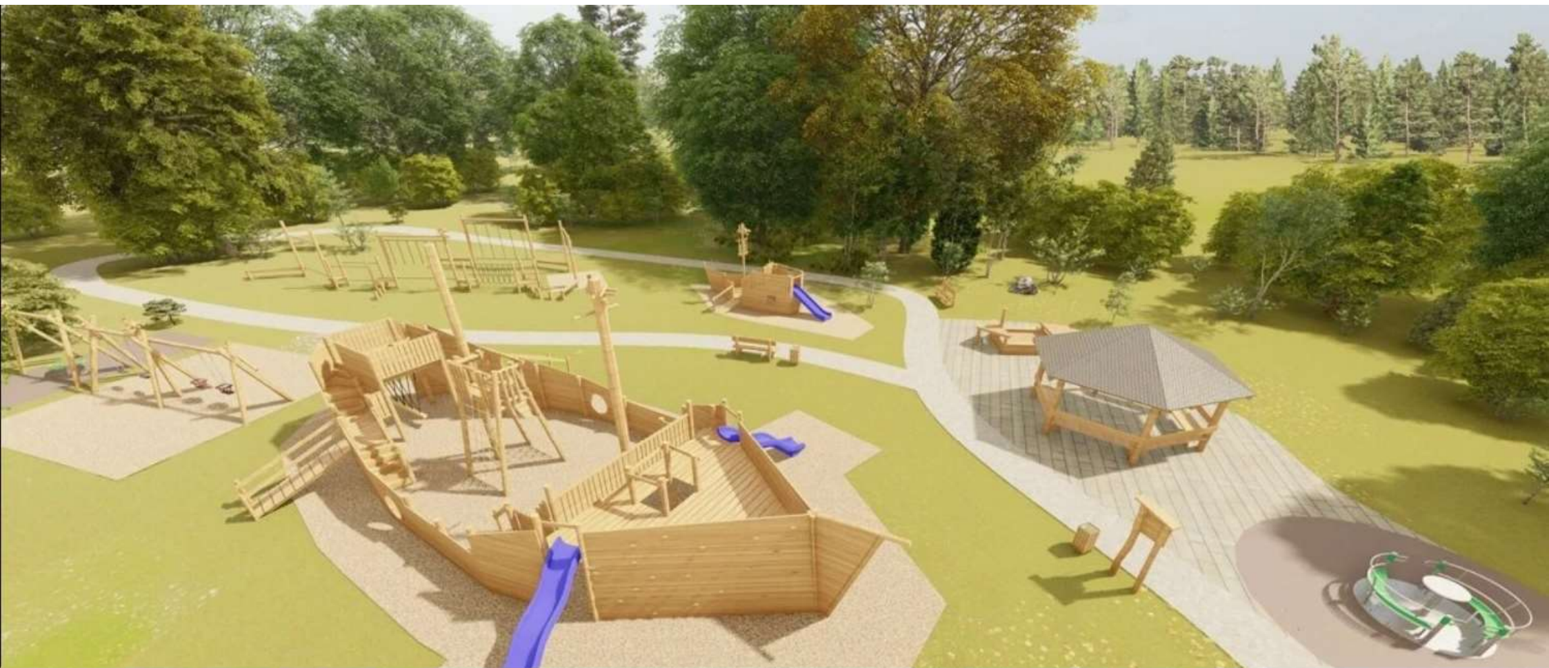
Detské ihrisko na Šibeničke